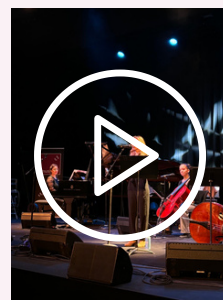
"Sans toi", live au Carreau du Temple